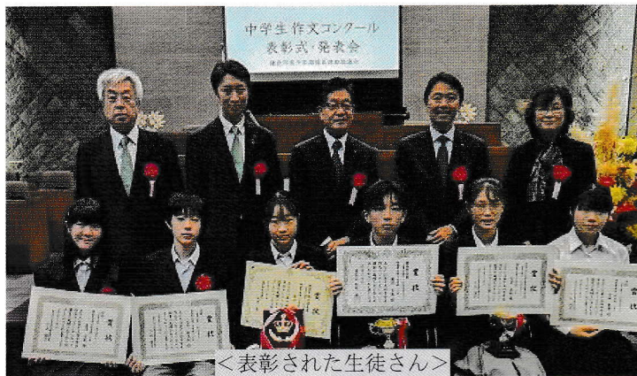
<表彰された生徒さん>