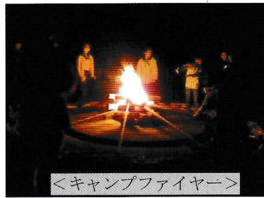
<キャンプファイヤー>

10月21日・22日県立愛川ふれあいの村にて鎌倉市青少年指導員連絡協議会主催、毎年恒例の「子どもキャンプ」が開催され総勢88名が参加。野外炊事、キャンプファイヤー、ディスクゴルフ等、楽しい2日間を過ごすことができました。