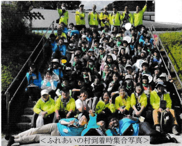
<ふれあいの村到着時集合写真>

10月21日・22日県立愛川ふれあいの村にて鎌倉市青少年指導員連絡協議会主催、毎年恒例の「子どもキャンプ」が開催され総勢88名が参加。野外炊事、キャンプファイヤー、ディスクゴルフ等、楽しい2日間を過ごすことができました。